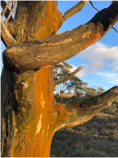
Jong en oud.