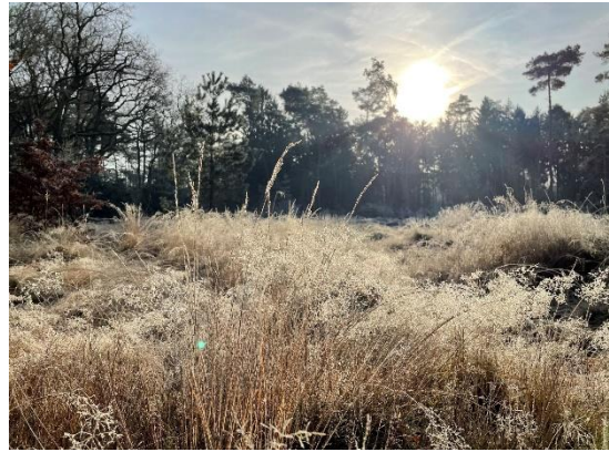
Dieren houden zich schuil.